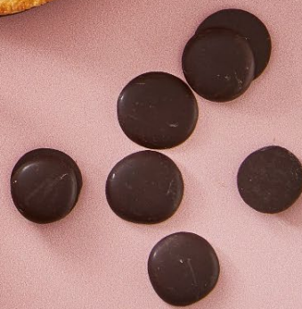
ODENSE Overtræk Mørk