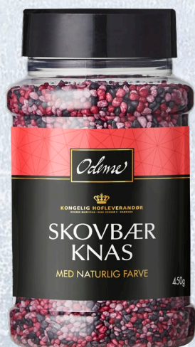
ODENSE Skovbær Knas 6 x 450 g