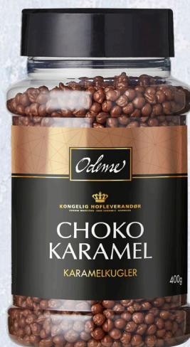
ODENSE Choko Karamel 6 x 400 g