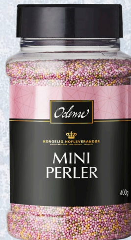
ODENSE Mini Perler 6 x 400 g