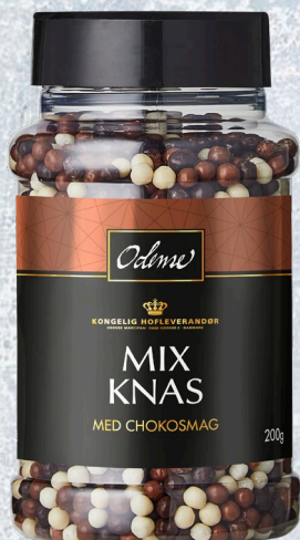
ODENSE Mix Knas 6 x 200 g