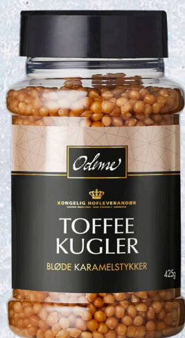
ODENSE Toffee Kugler 6 x 425 g